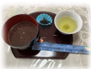
当日は会計に買い 物に、そして食べる のに大忙しでした！