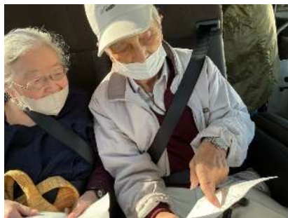
今いる場所を絵地図で確認しながら・・・