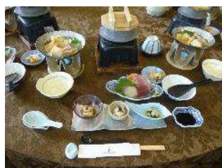
今津サンブリッジホテルでの豪華ランチ！