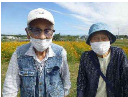
竜王のコスモス畑にて