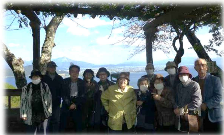
奥琵琶湖の展望台にて“半”集合写真