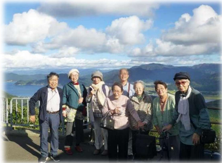
三方五湖 レインボーライン展望台にて