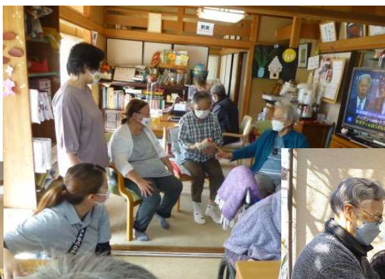
ゆめとまの家へのお出かけ