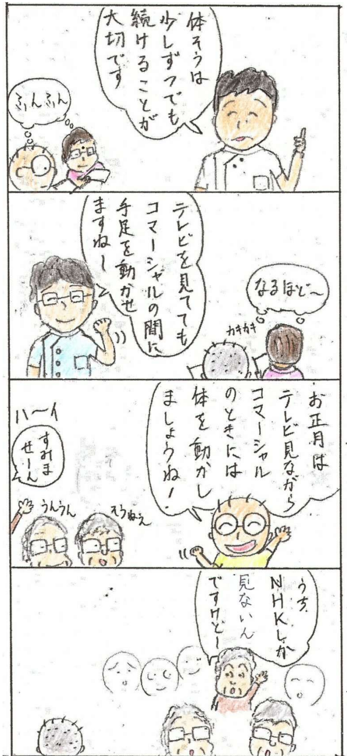
◎べつにCM中じゃなくてもいいですよ～

おしどりふれあいだよりは、法人のホームページにも掲載しています。また、ふれあいの家の日々の活動もブログに掲載しています。ぜひご覧ください。