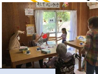
小さな訪問者と運動！！