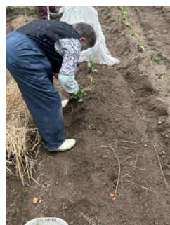
玉ねぎたくさん採れました