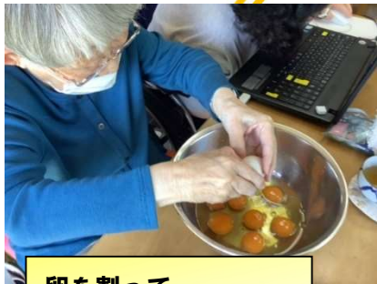
卵を割って・・・