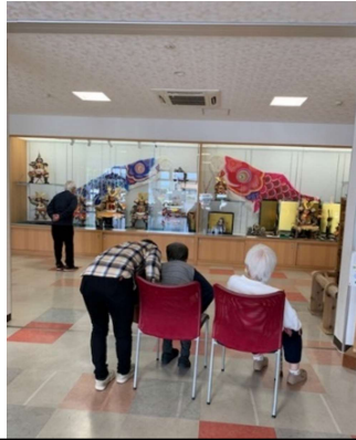
公民館へ5月人形を観に♪