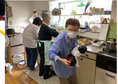
食後は連携により片付けが あっという間に♪