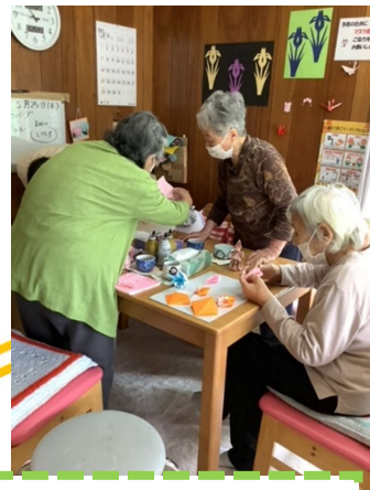
折り紙の教え合い🍀