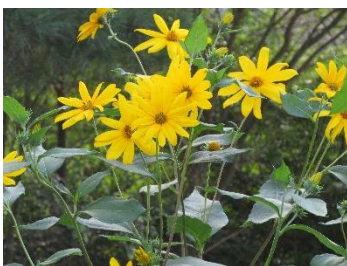
にぎやかに植えました！

出会い毎日おしゃべりに花を咲かせ楽しく暮らしています。食事も3食おいしいし、食後の座談会は大きな楽しみの一つ。子どもたちとは関係も良好で孫を連れて会いに来てくれますし、一緒に出掛けることもよくあります。ピスガの友人たちとは一緒に近くのスーパーへ買い物に出かけたり、近くの公園まで散歩に行ったり、週に1回デイサービスも利用し健康的な生活を送っています。ピスガに来てからよく笑うようになりました。若くなったと言われることが増え嬉しい限りです。思い切ってピスガに