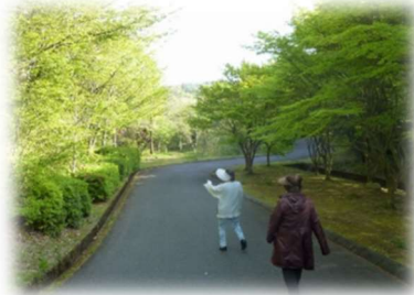
6月にはこんな風に！