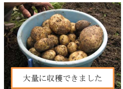
大量に収穫できました