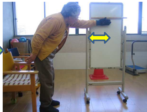
なないろ体操開始半年後（25cm）

ファンクショナルリーチ （腕を前に出し立った姿勢から足を動かさず、どこまで手を前にできるかを見るバランス評価）では、体が前屈みにできるようになり、 6cm の伸びました。バランスの向上が見られています。