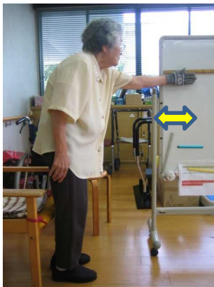
なないろ体操開始前（19cm）

昨年の7月よりなないろ体操と座る、立つ、歩くの運動を開始し、皆さんの基礎体力の向上を目指してきました。今までのお便りでもご紹介させていただきましたが、筋力やバランスに向上が見られ、変化が見られる方が増えてきています。