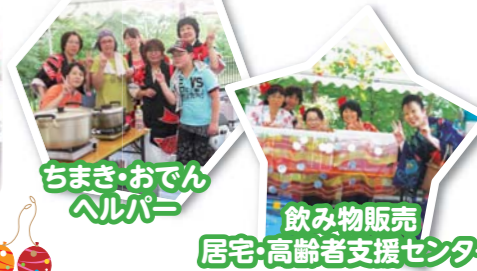
ちまき・おでん ヘルパー