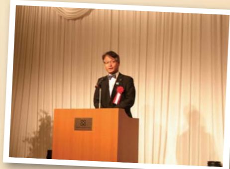
谷畑 英吾市長 ご祝辞