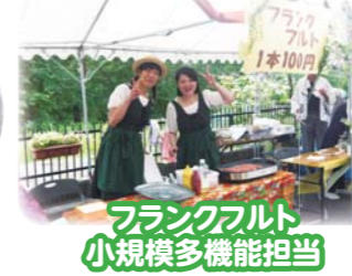
フルーツ 小規模多機能担当