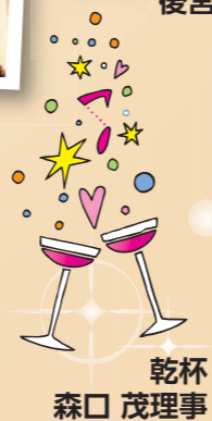
乾杯 森口 茂理事