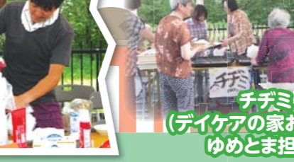
チヂミ (デイケアの家おしどり、ゆめとま担当)