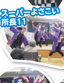
スーパーよさこい 所長11