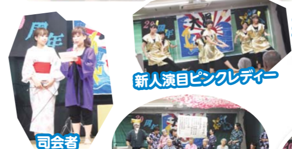
新人演目ピンクレディー