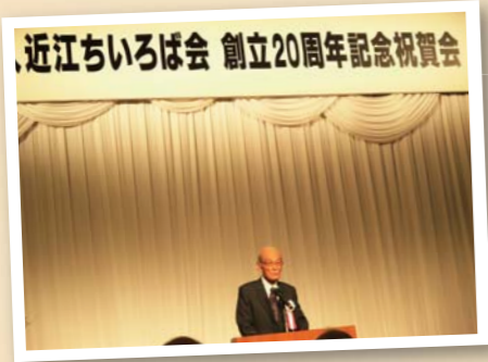
近江ちいろば会 創立20周年記念祝賀会