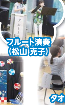
フルーツ演奏 (松山 克子)