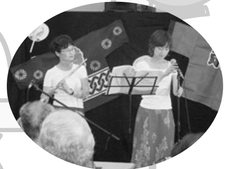
フルート演奏(松山ファミリー)