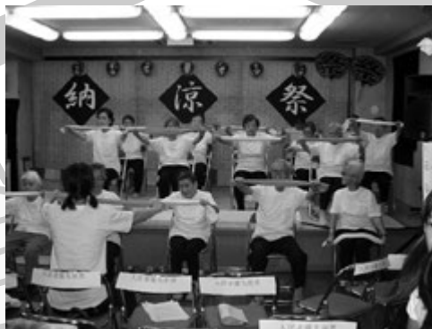
タオル体操(ケアハウス入居者)