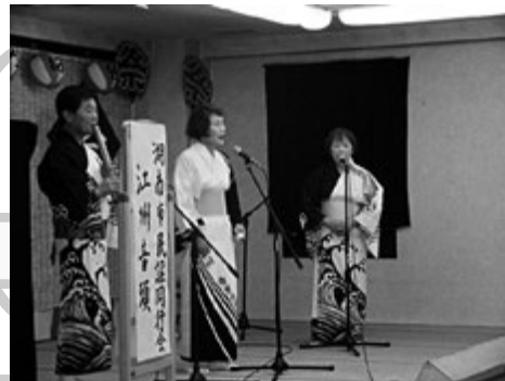
民謡・江州音頭(湖南市民謡同好会)