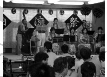
ウクレレ演奏(パイナップル)