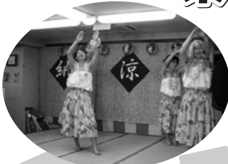
炎のフラダンス(デイサービス職員)