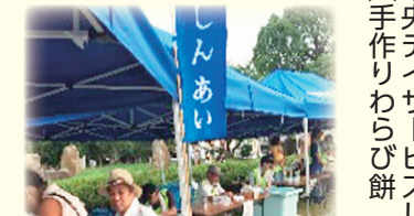
中央デイサービスしんあい (手作りわらび餅 販売)

地域の夏祭りに、屋台をだして、地域の人たちと交流することができました。地域の一員として、働くことが出来感謝しています。とびっきり美味しい「焼きそば・わらび餅」の販売を通して利用者様・入居者様は働いていた頃に戻られた気分になられていました。