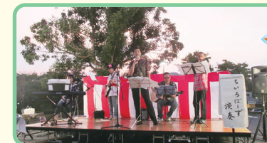
ちろばーズの演奏