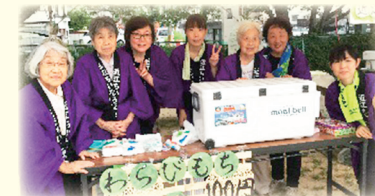
グループホームぼだいじ (わらび餅 販売)