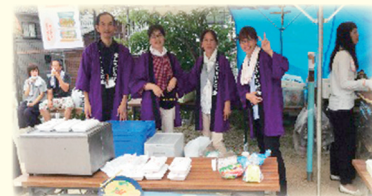
デイサービスいこい、ヘルパーステーション (焼きそば 販売)