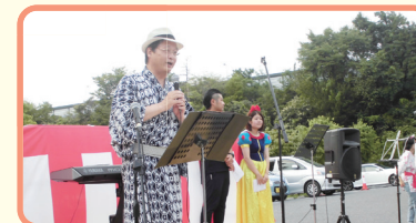
谷畑英吾市長のご挨拶