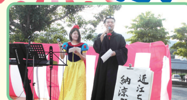
司会の息もびったり

職員が総出で、司会、演奏、屋台の売り子、もてなしで、ご利用者様、ご家族様、地域の方々と交流することができました。職員のチームワークもよく、期待以上の楽しい夏祭りでした。