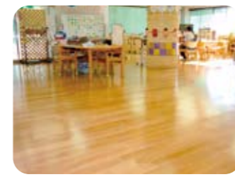
デイサービスセンター虹

床の張り替え前に比べて、フロアが明るくなり、床が輝いて清潔感溢れるデイサービスのルームに変わりました。ご利用者様が来所されて、すぐに開口一番、「きれいやなあ」と言って下さいました。朝出勤すると、朝日に輝く床を見て心機一転頑張っていこうと職員一同思っております。今後とも引き続きご愛顧賜りますよう、何卒宜しくお願い申し上げます。