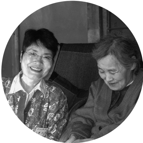
“お話しボランティア” 話しもはずんでいます。