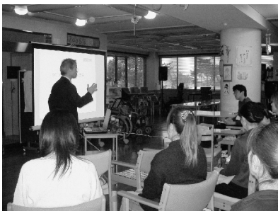
2006年方針発表会 4月3日