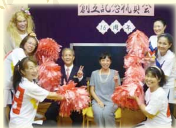
館長と10年勤続者が祝福されています

平成23年9月1日、法人の理事、監事様をはじめ多くの職員が集まり、盛大に法人の“創立記念式典”を行いました。式典では、法人創設者の後宮理事より“創業のこころ”をご講話頂き、あわせて永年勤続表彰を行いました。