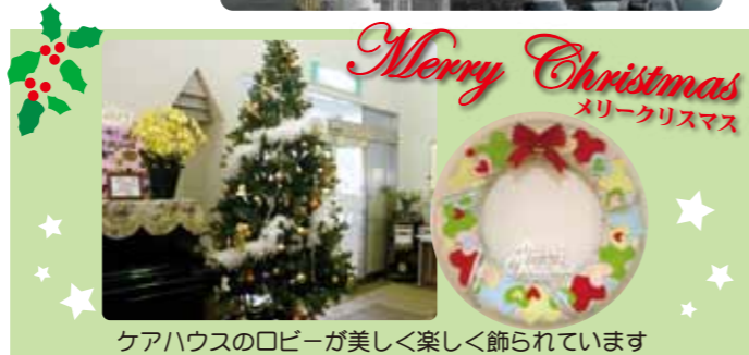
ケアハウスのロビーが美しく楽しく飾られています